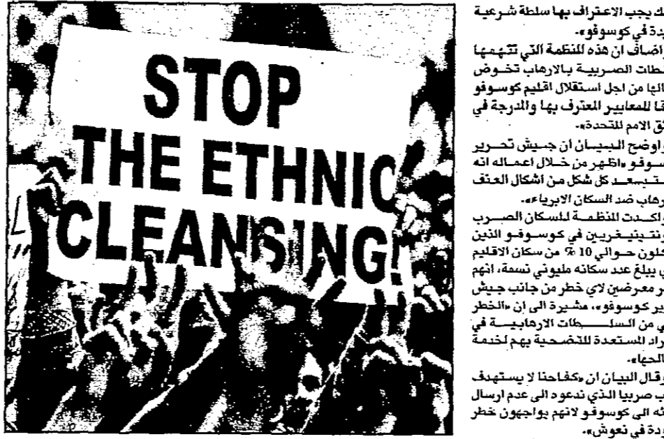
مناظر من البانيا في كوسوفو يوم سبت 10 آذار 1998 الذي أوقف سلسلة التطهير العرقي الجوربي